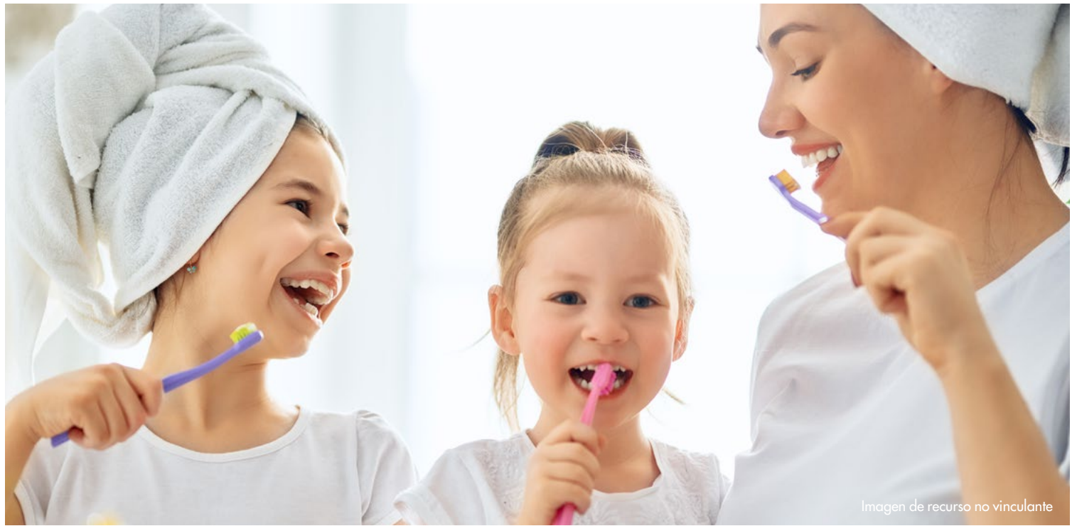
Imagen de recurso no vinculante