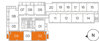
Plantas 02 a 09