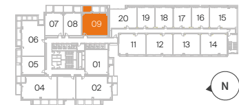
Plantas 02 a 09